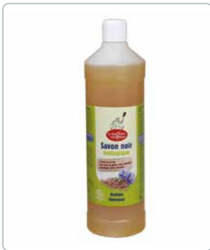
6701 ALLROUNDRENGØRING hørfrøolie 1L ØKO Lavet på hørfrøolie. Rengøre og fjerner fedt på bl.a. fliser, klinker, komfurer m.m.