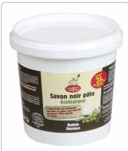
6703 SÆBE-PASTA olivenolie 1kg ØKO Lavet på presserester fra oliven. Rengøre og fjerner fedt på bl.a. fliser, klinker, komfurer m.m.