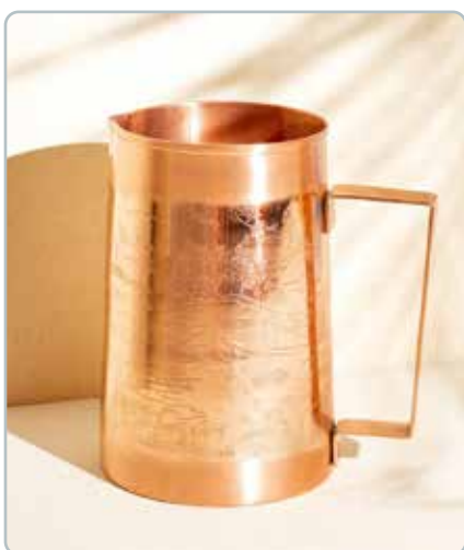
10055 PARADISE KOBBER KANDE til vand Mål: 1500ml