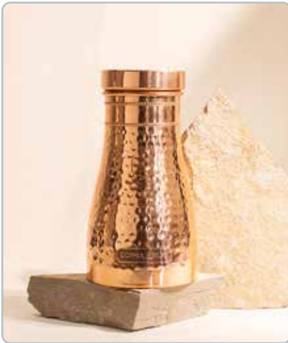
10070 LUXUS KOBBER KARAFEL HAMMERED til vand Mål: 1000ml