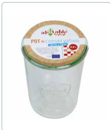
6883 OPBEVERARINGSGLAS med kork låg 0,9L Mål: 100x150 mm Til opbevaring af fx madvarer. Kan uden låg gå i ovn, mikroovn og fryser.