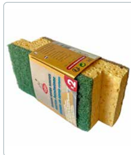
6711 RENGØRINGSSVMPE 2 stk lavet af genbrugsplast. Brug dem i den daglige rengøring. Grøn overflade lidt hårdere og gul blød - vær opmærksom på overfladen.