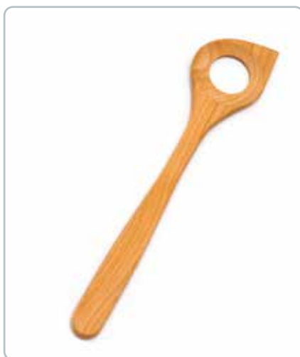
6831 GRYDESKE med hul i kirsebærtræ Mål: 300 mm Hullet i skeen er ideel til fx suppe med pasta i, da hullet er med til at skille pastaen ad.