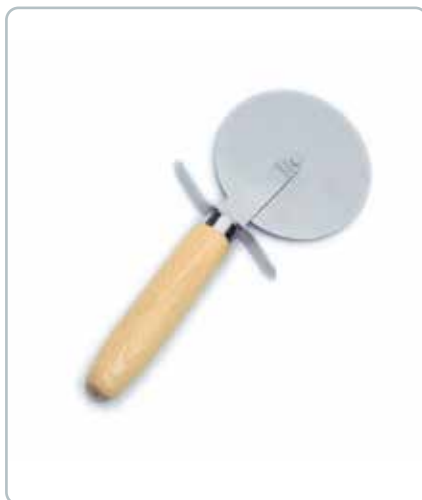
6987 PIZZASKÆRE med skaft i bøgetræ Mål: 200 mm Funktionelt og dekorativt element i dit køkken.