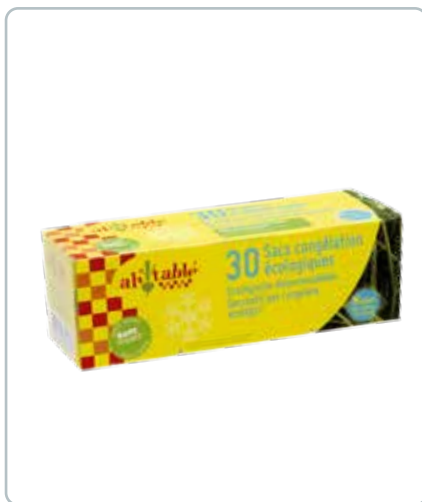
6736 FRYSEPOSER af bioplastik 30stk á 2,5L Miljøvenlige og lavet af biomasse. 100% genanvendelige og der følger lukkestrips med.