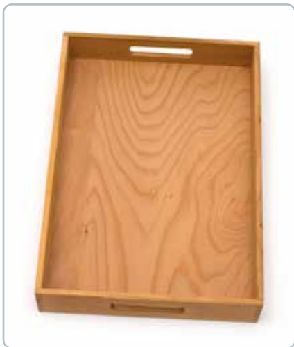
6867 SERVERINGSBAKKE i kirsebærtræ Mål: 450x330 mm Stilfuldt design med høj kant og store greb, som gør bakken let at bruge.