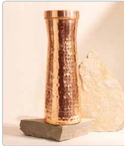
10080 LUXUS KOBBER KARAFELHAMMERED til vand Mål: 1200ml