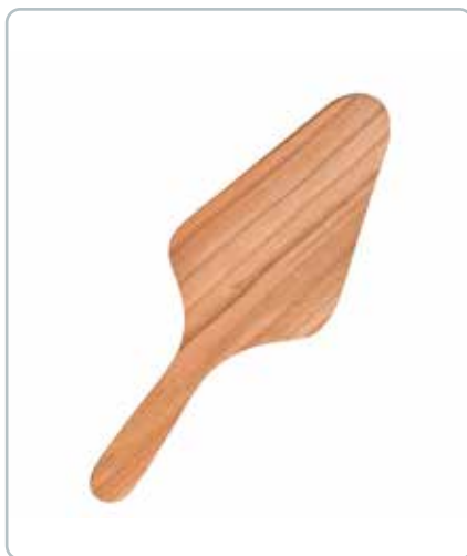
6829 PIZZA SKE i kirsebærtræ Mål: 300 mm En praktisk hjælper i køkkenet. Glider ubesværet ind under pizzastykket.