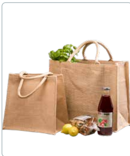
8652 JUTE INDKØBSNET uden logo Mål: 360x430x190 mm Tænk på miljøet og spar på plastikposerne. Få evt. trykt dit eget logo på poserne.