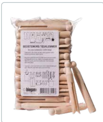
6821 BEDSTEMORKLEMMER En retro-udseende træklemme. Brug dem til vasketøjet på tørresnoen, til hobbyarbejdet og pynt.