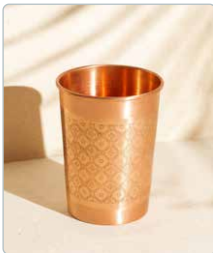
10030 MOSAIC KOBBER KRUS til vand Mål: H: 10 cm, Ø: 6 cm - 300ml