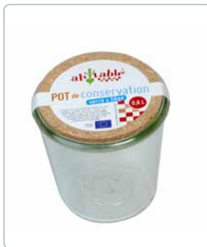
6882 OPBEVERARINGSGLAS med kork låg 0,6L Mål: 100x110 mm Til opbevaring af fx madvarer. Kan uden låg gå i ovn, mikroovn og fryser.