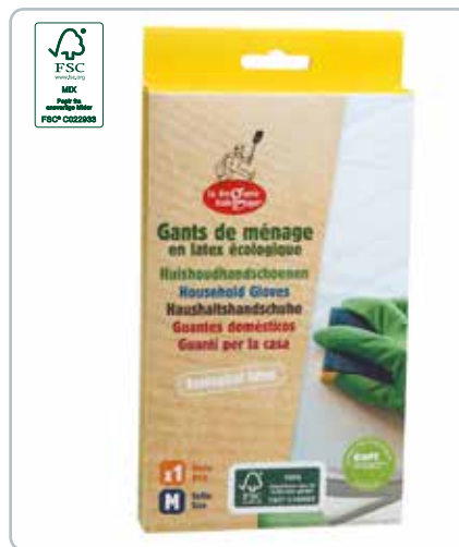
6725b LATEX HANDSKER str. M FSC Gummiet er fra FSC certificerede plantager. Handskerne kan bruges til opvask, diverse husholdningsopgaver, havearbejde m.m.