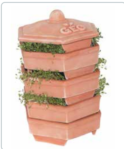
8598 TERRACOTTA Sprouter GEO Spire sprouteren har et innovativt afstandssystem til at regulere lys og mørke.