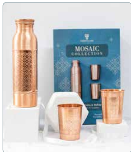
10040 MOSAIC KOBBER GAVESÆT

Flaskerne og glassene er desuden er belagt med et beskyttende lag fødevarerodkendt lak. Indeni fremstår produkterne helt rå og ubehandlede.