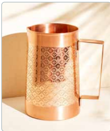
10060 MOSAIC KOBBER KANDE til vand Mål: 1500ml