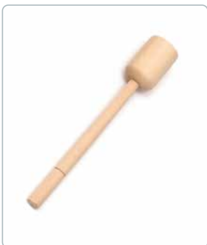
6875 KARTOFFELSTAMPER i bøgetræ Mål: 300 mm God til at mase og knuse kartofler.