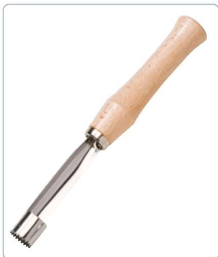
6988 KERNEHUS FJERNER med skaft i bøgetræ Mål: 170 mm Fjerner nemt kernehuse. Udstikker anven- des til at stikke igennem frugten fra stilk til bund.