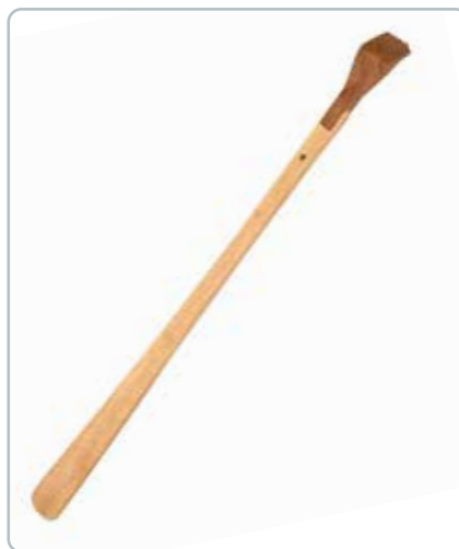
6896 SKOHORN/KLØPIND i bøgetræ Mål: 590 mm 2-i-1 redskab som gør det nemt at få sine sko på eller klø sig på ryggen.