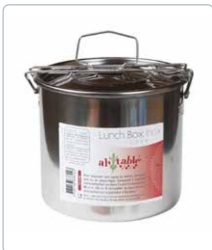
7150 MADKASSE rund i rustfrit stål Mål: 140x120 mm 2 rum til opbevaring af både kolde og varme retter.