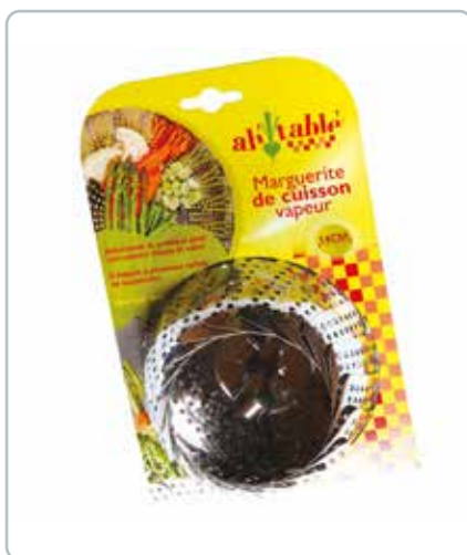
6740 GRØNTSAGSDAMPINDSATS rustfri stål Ø: 140 mm Indsatsen sættes ned i en gryde med lidt vand. Velegnet til grøntsager, fisk og skaldyr.