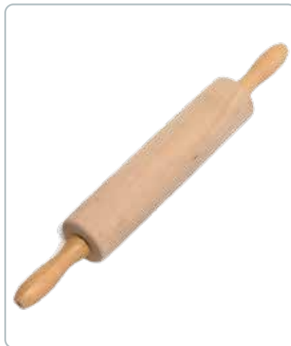
6879 KAGERULLE med plastik leje i bøgetræ Mål: 450 mm Kvalitets kagerulle med god tyngde og størrelse.