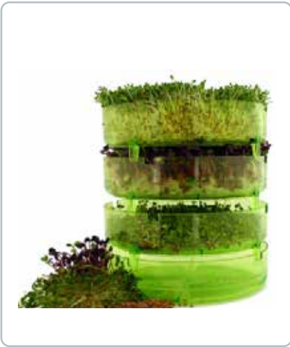
8599 SPIRE SPROUTER GEO Til dig, der har grønne fingre og kan se det skønne i at dyrke grøntsagerne selv fra bunden.