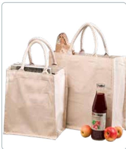
8662 BOMULDS INDKØBSNET uden logo Mål: 360x430x190 mm Tænk på miljøet og spar på plastikposerne. Få evt. trykt dit eget logo på poserne.