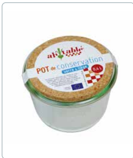
6881 OPBEVERARINGSGLAS med kork låg 0,4L Mål: 100x75 mm Til opbevaring af fx madvarer. Kan uden låg gå i ovn, mikroovn og fryser.