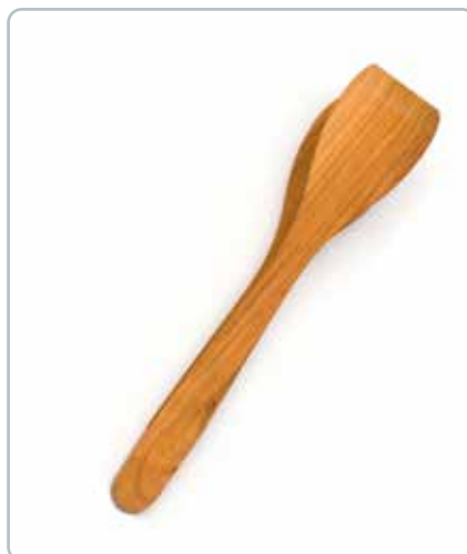
6823 SALAT TANG i kirsebærtræ Mål: 300 mm Nemt at håndtere og meget dekorativt i salatskålen.