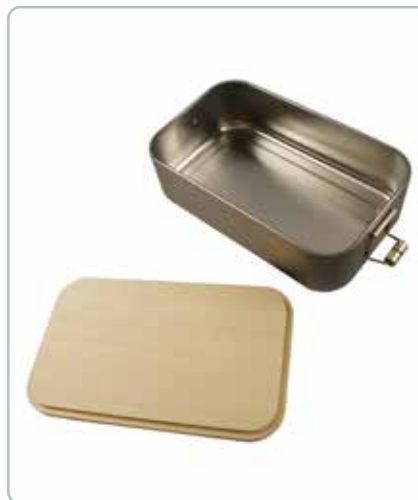
6865 MADKASSE i metal med trælag af bøg Mål: 115x180x65 mm Låget kan vendes og med fordel bruges som smørebræt.