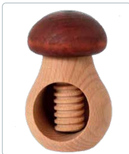
6866 NØDDEKNÆKKER med gevind Mål: 65 x 65 x 110 mm Bøgetræ i 2 nuancer med form som en svamp. Flot i nøddekurven.