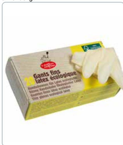
6726c LATEX HANDSKER tynde str. L FSC Bliv fri for tørre og beskidte hænder, og den plastikagtige lugt. Handskerne er puderfri. Du får et produkt som er bredt anvendeligt.