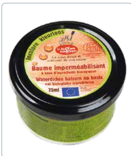
6723 LÆDER BALSAM, neutral 75ml Ecocert Kan bruges til at rengøre, sikre vandafvisning og til at forlænge levetiden på som fx tasker, sko, tøj