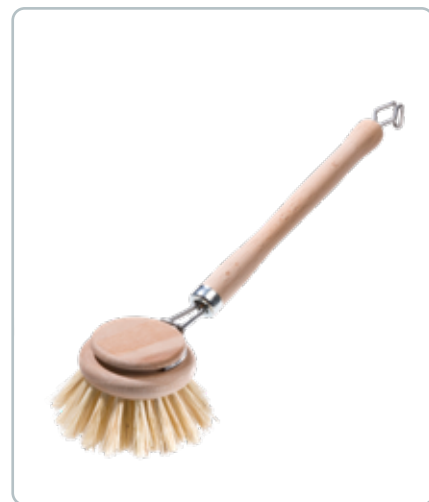
6801 LUKSUS OPVASKEBØRSTE af bøgetræ D: 50 mm Fibrene er lavet af bladribbene fra agave kaktus