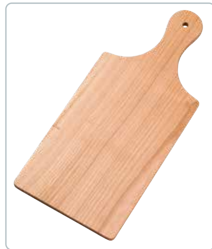
6874 SKÆREBRÆT m.håndtag i kirsebærtræ Mål: 150x340 mm Flot farvespil. Flot til anretninger.