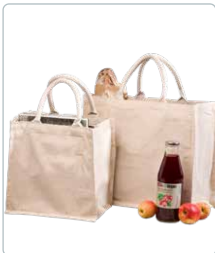
8666 BOMULDS INDKØBSNET uden logo Mål: 300x300x200 mm Tænk på miljøet og spar på plastikposerne. Få evt. trykt dit eget logo på poserne.