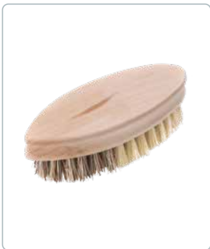
6810 GRØNTSAGSBØRSTE i bøgetræ Mål: L138 x B54 x H38 mm Med særligt formet kant for bedre greb.