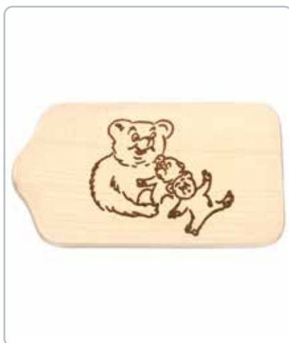
6991 SMØREBRÆT med bjørne i bøgtræ Mål: 130x230 mm Dekorativ smørebræt til de mindste.