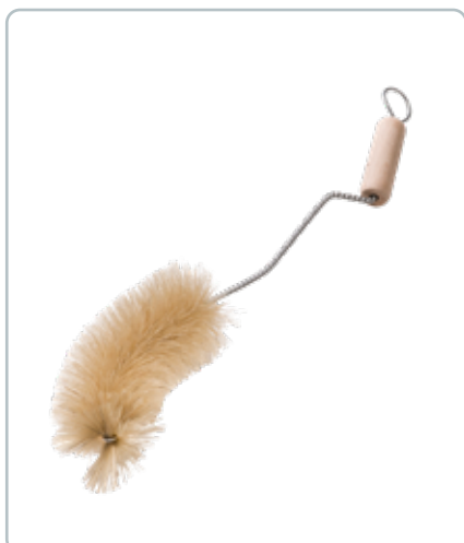
6848 SUTTEFLASKEBØRSTE med bøgetræsskaft D: 65 mm En børste med dyrehår, der er bøjet så den nemt når ud i alle kanterne af flasken.