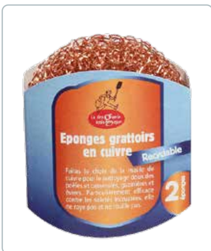
6712 KOBBERSVAMPE 2 stk Rengører nænsomt gryder, pander, komfur og køkkenvask. Svampene hverken ridser eller ruster.