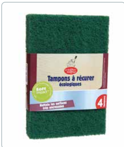
6710 SKURESVMPE 4stk (lavet genbrugs flasker) Ideel til særlig beskidte overflader som fx gryder og pander.