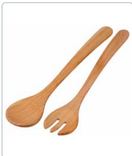
6841 SALATBESTIK i kirsebærtræ Mål: 350 mm Dekorativt bestik som ligger godt i hånden.