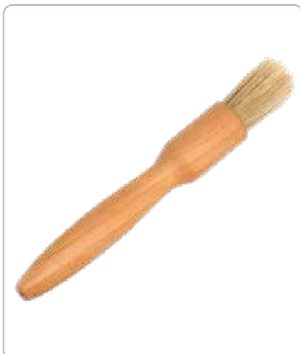
6845 BAGEPENSEL i kirsebærtræ Mål: 190 mm God all round pensel som er god til at holde på og fordele marinader, æggemasse og vand.