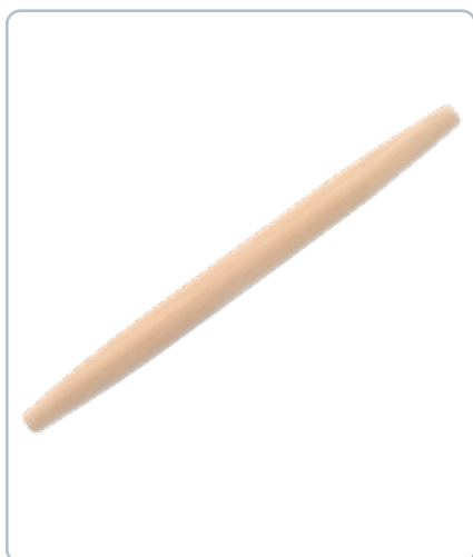
6833 PIZZARULLE i bøgetræ Mål:600x40 mm Godt råd: drys rullen med lidt mel inden brug, så klistre dejen mindre.