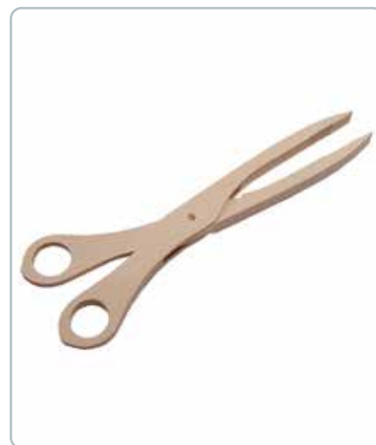
6857 GRILLTANG i bøgetræ Mål: 290mm Ideel til brug på grill og pander.