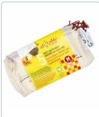
6755 GRØNTSAGSPOSE 5stk M Øko bomuld Mål: 200x300 mm Kan bruges til at transportere og opbevare frugt og grønt.