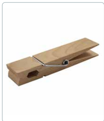
6859 KÆMPEKLEMMER i bøgetræ Mål: 35x150 mm En fin og en sjov gimmick til hjemmet. Brug til pynt, til at hænges børnenes tegninger op med, og meget andet.