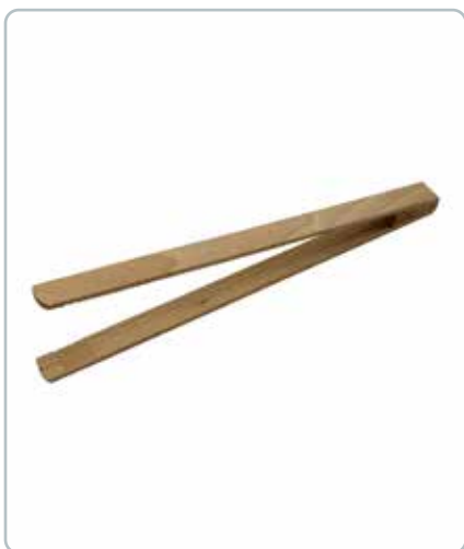
6858 TANG i bøgetræ Mål: 320 mm Let at håndtere og du undgår plastik i maden.