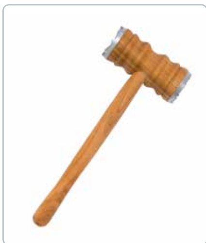
6892 Kødhammer i kirsebærtræ Mål: 280 mm Metal i enderne. Ligger godt i hånden.