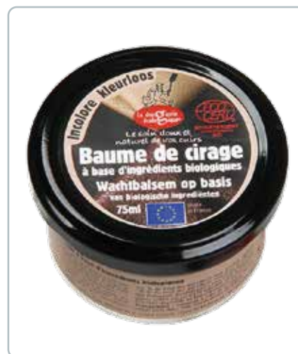
6720 SKOCREME neutral u/farve 75ml Ecocert Perfekt til vedligeholdelse af læderprodukter, når de skal rengøres, plejes, fornyes og skinne.