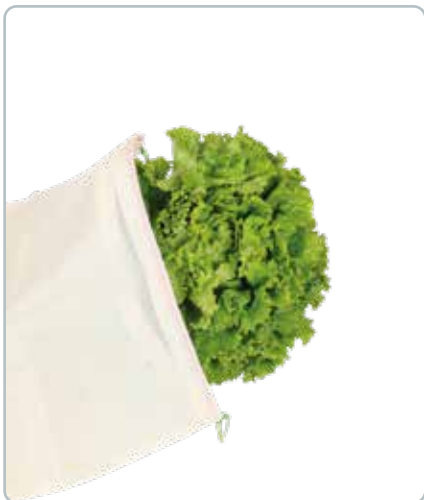
6750 GRØNTSAGSPOSE 3stk XL Øko bomuld Mål: 400x400 mm Kan bruges til at transportere og opbevare frugt og grønt.