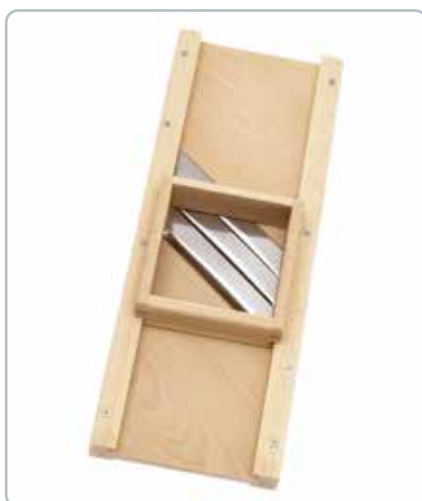
6893 Kål rivejern i bøgetræ Mål : 400x160 mm Effektivt redskab med 3 knivblade til at snitte kål.