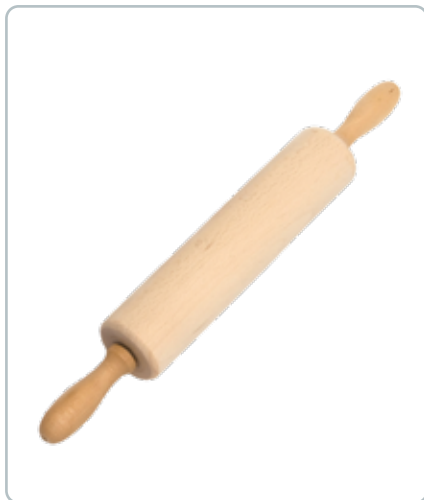
6878 KAGERULLE med metal akse i bøgetræ Mål : 400 mm Kvalitets kagerulle med god tyngde og størrelse.