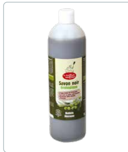
6702 ALLROUNDRENGØRING olivenolie 1L ØKO Lavet på presserester fra oliven. Rengøre og fjerner fedt på bl.a. fliser, klinker, komfurer m.m.