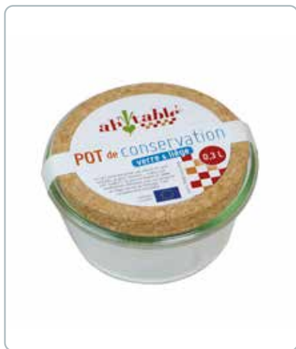
6880 OPBEVERARINGSGLAS med kork låg 0,3L Mål: 100x60 mm Til opbevaring af fx madvarer. Kan uden låg gå i ovn, mikroovn og fryser.