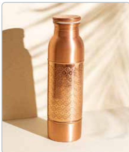
10005 MOSAIC KOBBER FLASKE til vand Mål: H: 26,5 cm, Ø: 7,5 cm - 900ml