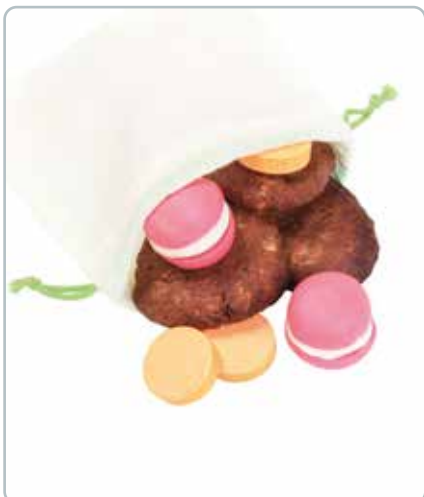
6753 GRØNTSAGSPOSE 8stk XS Øko bomuld Mål: 4 stk 200x140 + 4 stk 160x160 mm Kan bruges til at transportere og opbevare frugt og grønt.