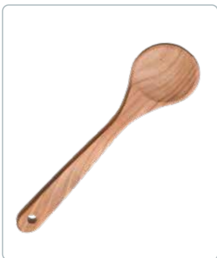
6836 GRYDESKE i kirsebærtræ Mål: 300 mm Grydeskeen ligger godt i hånden på grund af de afrundede hjørner.

Vask aldrig træprodukter i opvaskemaskinen.