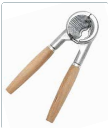
6895 NØDDEKNÆKKER med håndtag i bøgetræ Mål: 190 mm Fint redskab som ligger godt i hånden. Flot i nøddekurven.