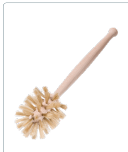
6850 GLASBØRSTE med bøgetræsskaft D: 65 mm Fibrene på børsten er af lyse dyrehår