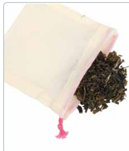
6754 TE POSER 5stk Øko bomuld Mål: 9x9 cm Snoren er lang nok til at bruge i både krus og tepotter.