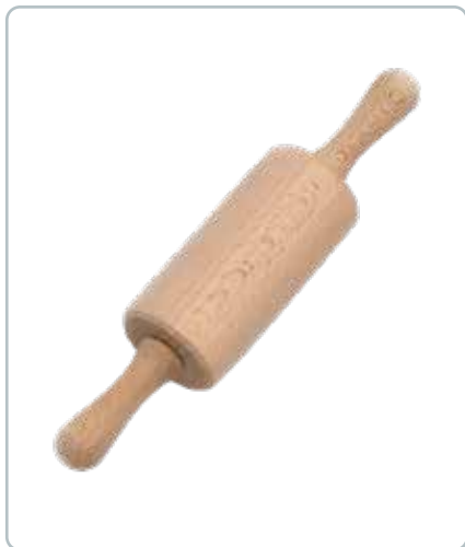
6877 BØRNEKAGERULLE i bøgetræ Mål: 170 mm Tag børnene med i køkkenet og skab en hyggelig fælles oplevelse.