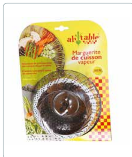
6741 GRØNTSAGSDAMPINDSATS rustfri stål Ø: 180 mm Indsatsen sættes ned i en gryde med lidt vand. Velegnet til grøntsager, fisk og skaldyr.