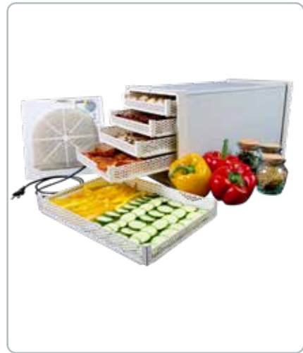
8595 DEHYDRATOR med 5 bakker GEO Med forskellige arbejdstemperaturer ved forskellige tidsperioder og specifikke programlængder i timer.