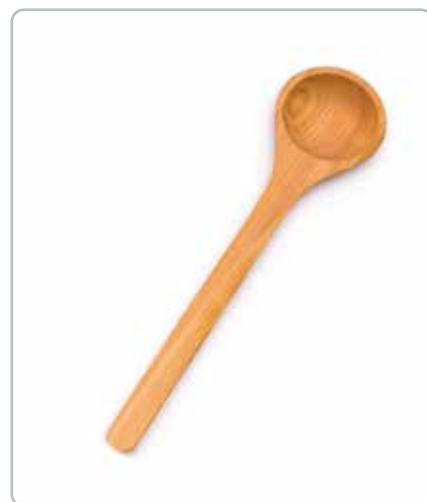
6827 GRØDSKE i kirsebærtræ Mål: 320 mm Grydeskeen ligger godt i hånden på grund af de afrundede hjørner.