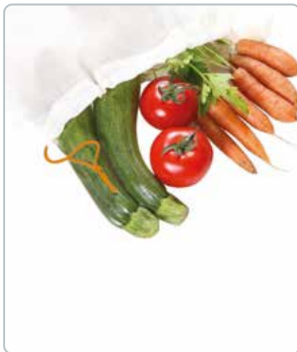
6751 GRØNTSAGSPOSE 5stk L Øko bomuld Mål: 300x330 mm Kan bruges til at transportere og opbevare frugt og grønt.