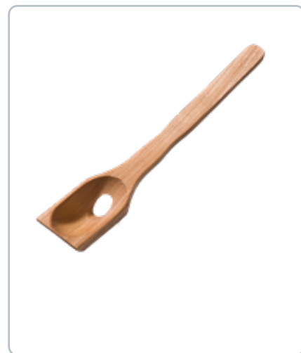
6834 OLIVENSKE MED HUL i kirsebærtræ Mål: 160 mm Selvom glasset er højt og slankt bliver olivenen på skeen.