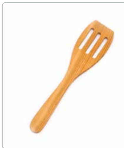
6830 PALETKNIV med riller i kirsebærtræ Mål: 300 mm Rillerne fungerer som si når man fx tager bøffer af panden, og man undgår stegefedt.