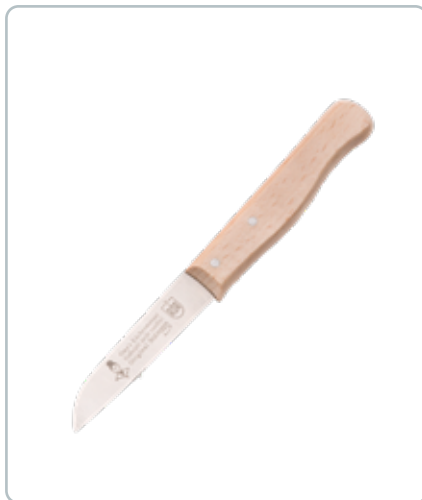
6984 OMA GRØNTSAGSKNIV med skaft i bøge- træ Længde: 160 mm Især god til de mindre grøntsager.