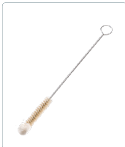
6849 BØRSTE TIL SUTTEFLASKETUD med uldtop D: 10 mm. En tynd børste der nemt når ind i sutteflasketuden. Uldtoppen sørger for ikke at ødelægge tuden. Lavet af lyse dyrehår.