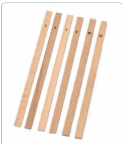
6876 MÅLEPINDE i bøgetræ Mål: 3/5/10 mm Gør det nemt at rulle fondant, marcipan og dej ud i en jævn tykkelse.