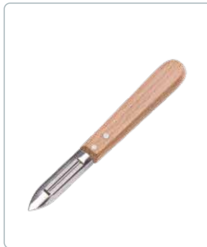
6986 SKRÆLLEKNIV med skaft af bøgetræ Knivblad af rustfrit stål Længde: 160 mm Kan bruges til både grøntsager og frugt.