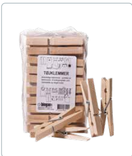
6820 TRÆKLEMMER Brug dem til vasketøjet på tørresnoen, til hobbyarbejdet, som et alternativt navneskilt eller noget helt fjerde.