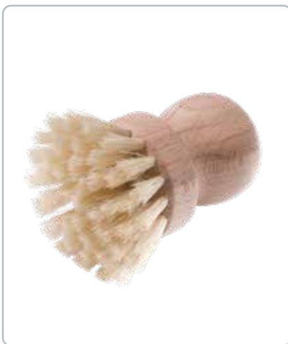
6840 CHAMPIGNONBØRSTE i bøgetræ Mål: H75 x D50 mm Champignon kan være svære at rengøre, men denne bløde børste gør det nemmere.