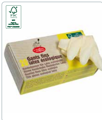
6726b LATEX HANDSKER tynde str. M FSC Bliv fri for tørre og beskidte hænder, og den plastikagtige lugt. Handskerne er puderfri. Du får et produkt som er bredt anvendeligt.