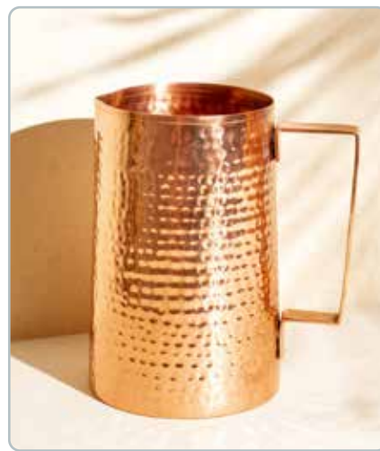
10065 HAMMERED KOBBER FLASKE til vand Mål: 1500ml