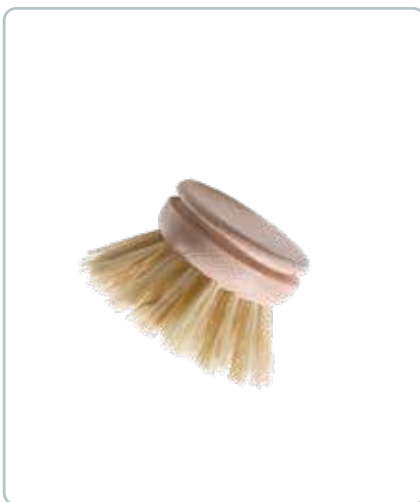
6805 OPVASKEHOVED af bøgetræ Udskifteligt opvaskehoved der passer til 6800 opvaskebørste, D: 40 mm