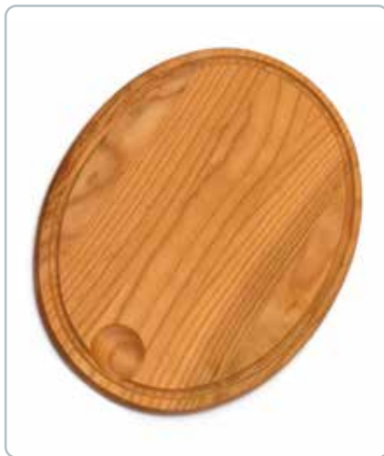
6873 SKÆREBRÆT oval i kirsebærtræ Mål: 380x280 mm Flot design så det både kan bruges til madlavning og servering,