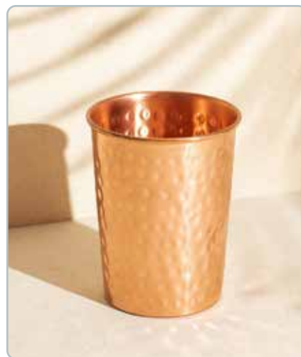
10035 HAMMERED KOBBER KRUS til vand Mål: H: 10 cm, Ø: 6 cm - 300ml