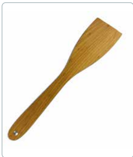
6837 PALETKNIV i kirsebærtræ Mål: 300 mm Med et blad som er slebet skrå nedefra, for at gøre det nemt at vende mad på panden.