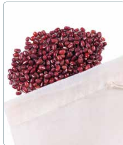
6752 GRØNTSAGSPOSE 5stk S Øko bomuld Mål: 200x280 mm Kan bruges til at transportere og opbevare frugt og grønt.