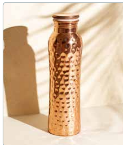
10010 CURVE HAMMERED KOBBER FLASKE til vand Mål: H: 26,5 cm, Ø: 7,5 cm - 900ml