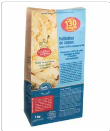
6700 SÆBESPÅNER 1kg ØKO Designet med henblik på håndvaskning af delikate tekstiler som fx uld og silke.