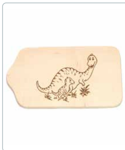
6992 SMØREBRÆT med dino i bøgtræ Mål: 130x230 mm Dekorativ smørebræt til de mindste.