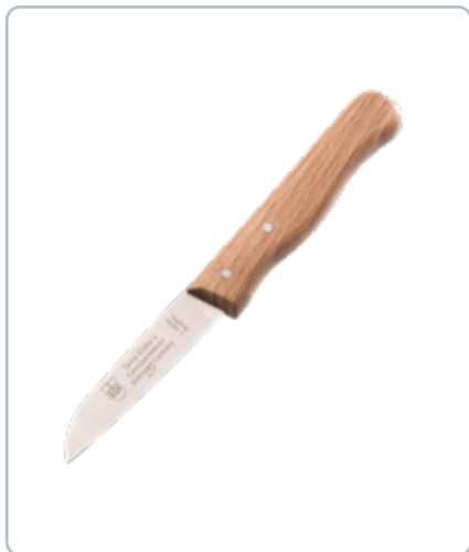
6982 TANTE GRØNTSAGSKNIV m/skaft i bøgetræ Længde: 170 mm God til alle typer af grøntsager - både til at snitte og skære.