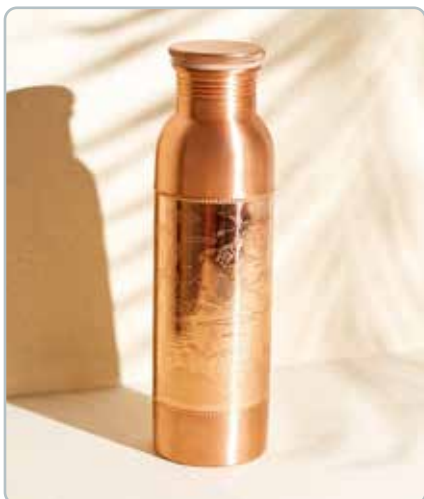
10000 PARADISE KOBBER FLASKE til vand Mål: H: 26,5 cm, Ø: 7,5 cm - 900ml