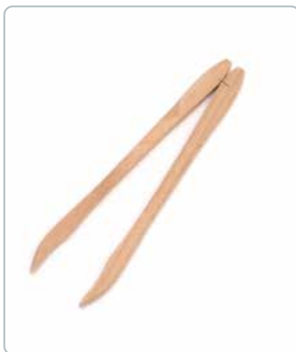
6989 OLIVENTANG i bøgetræ Mål: 250 mm Sikre en nem håndtering af oliven. Kan også bruges til drueagurker o.l.