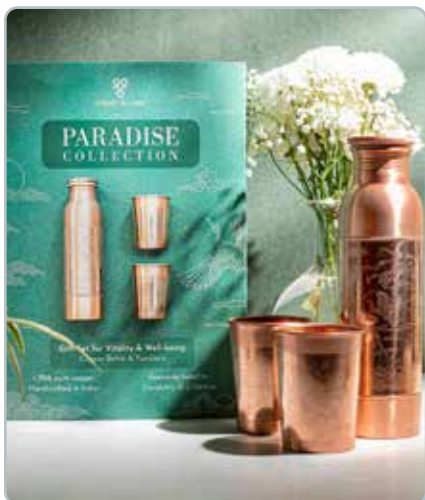
10045 PARADISE KOBBER GAVESÆT

Hvert produkt er formet af et enkelt ark rent kobber uden samlinger eller sømme.