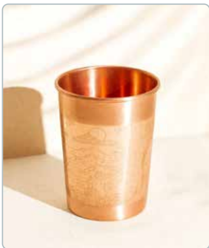
10025 PARADISE KOBBER KRUS til vand Mål: H: 10 cm, Ø: 6 cm - 300ml