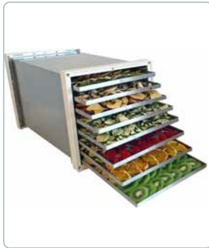
8594 DEHYDRATOR med 8 bakker GEO Når man tørrer frugt og grøntsager får de en helt anden smag, hvilket gør tørret frugt og grøntsager velegnede til snacks.