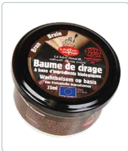
6722 SKOCREME brun 75ml Ecocert Perfekt til vedligeholdelse af læderprodukter, når de skal rengøres, plejes, fornyes og skinne.