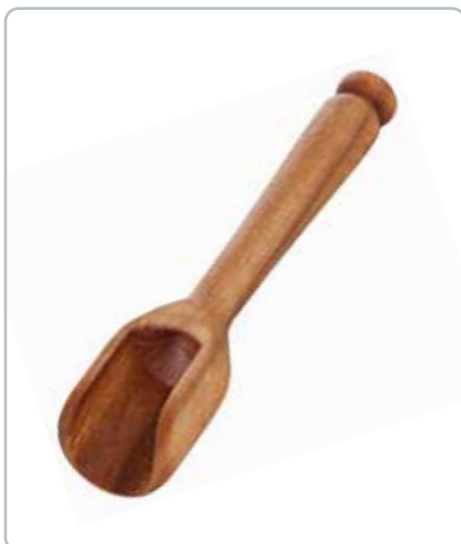
6842 SALT SKE lille i kirsebærtræ Mål: 80 mm Afrundede og bløde linjer som pynter i saltkaret, sukkerskålen m.m.