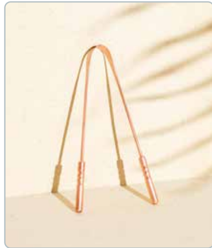
10080 KOBBER TUNGESKRABER Fjerner tungebelægning og sørger for en frisk mund.