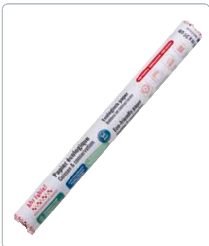
7100 MAD- OG BAGEPAPIR Mål 39 cm. x 15 meter Kan bruges i stedet for sølvpapir, plastik- folie og som bagepapir op til 220 grader.