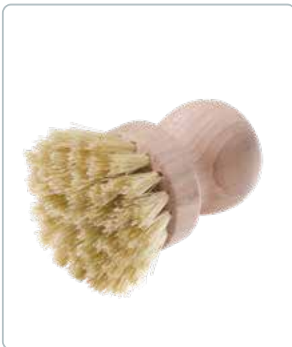
6815 GRYDEBØRSTE af bøgetræ Mål: H80 x D50 mm Børstens fibre er lavet af bladribbene fra agave kaktus

Ved at anvende disse fibre, får man et godt og funktionelt redskab med lang levetid.