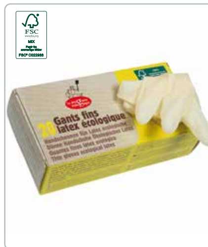
6726c LATEX HANDSKER tynde str. L FSC Bliv fri for tørre og beskidte hænder, og den plastikagtige lugt. Handskerne er puderfri. Du får et produkt som er bredt anvendeligt.