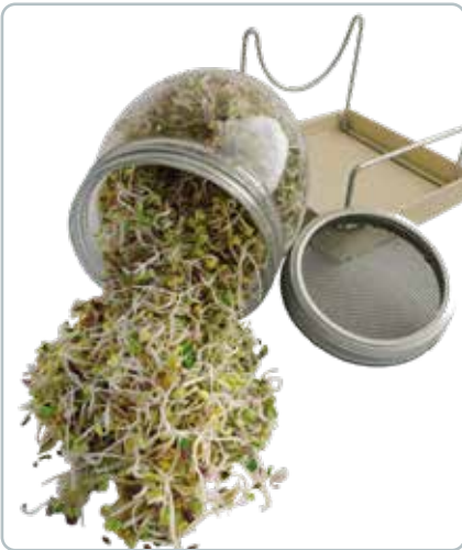
8597 SPIRE GLAS GEO Et spireglas er en af de mest enkle og effektive metoder til at lave dine egne velsmagende spirer hjemme på få dage.