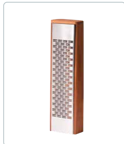
6864 OSTERIVEJERN i box i kirsebærtræ Mål: H:225 x B:80 x D:45 mm Rivejernet er yderst dekorativt. Riven tages nemt af, så det hele er nemt at rengøre.