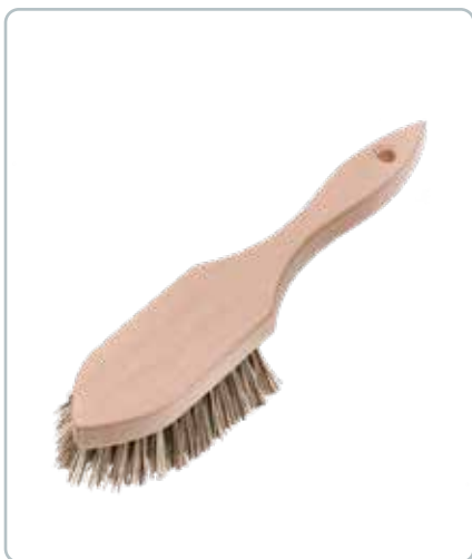
6856 HJØRNEBØRSTE i bøgetræ Her har man en børste med rigtig god rengøringsevne, som kan komme helt ind i hjørnerne