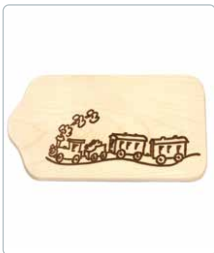
6990 SMØREBRÆT med tog i bøgtræ Mål: 130x230 mm Dekorativ smørebræt til de mindste.