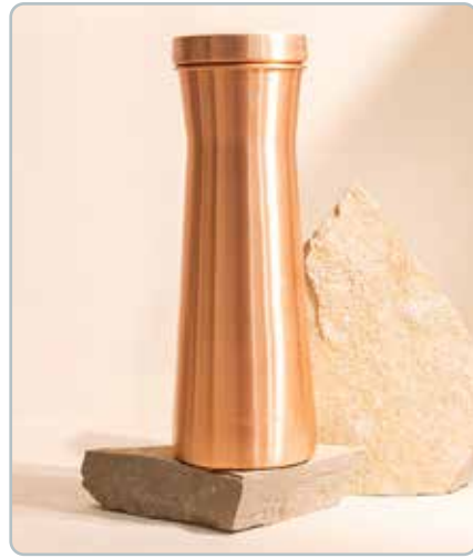
10085 LUXUS KOBBER KARAFEL MAT til vand Mål: 1200ml