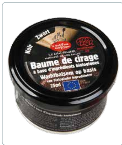
6721 SKOCREME sort 75ml Ecocert Perfekt til vedligeholdelse af læderprodukter, når de skal rengøres, plejes, fornyes og skinne.