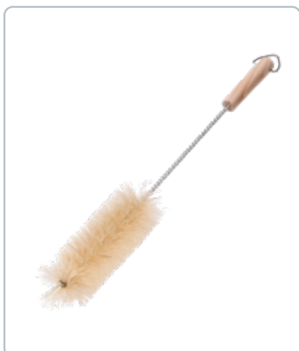
6852 FLASKEBØRSTE med træhåndtag af bøg D: 50 mm Fibrene på børsten er af lyse dyrehår.