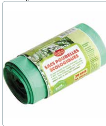
6730 AFFALDSDPOSER grønne af bioplastik 30L Poserne har en snortrækklugning, som gør dem nemme at håndtere - ikke egnet til fødevarer.