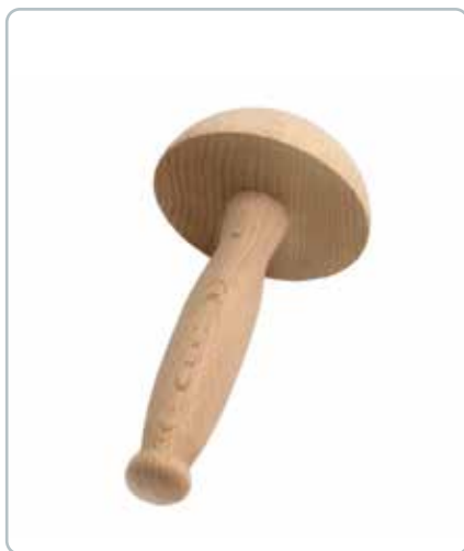
6894 STOPPESVAMP i bøgetræ Mål: 130 mm Stoppesvamp er et godt redskab når du stopper strømper.

Det at stoppe strømper og lignende er blevet mere populært, og derfor er dette flotte instrument kommet ind i sortimentet.