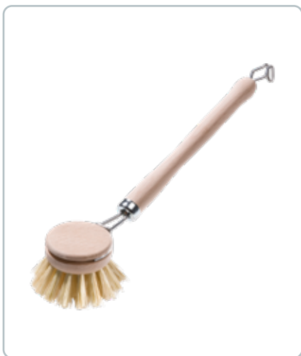
6800 OPVASKEBØRSTE i bøgetræ med udskifteligt opvaskehoved D: 40 mm. Fibrene på på børsten er af bladribbene fra agave kaktus.