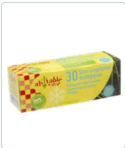
6735 FRYSEPOSER af bioplastik 30stk á 1L Miljøvenlige og lavet af biomasse. 100% genanvendelige og der følger lukkestrips med.