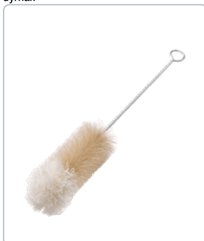
6853 FLASKEBØRSTE med uldtop D: 55 mm Den er særligt velegnet til glaskander og karafler. Fibrene på børsten er af lyse dyrehår.