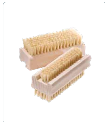
6825 NEGLEBØRSTE af bøgetræ Mål: L95 x B35 x H40 mm Fibrene på børsten er fra bladribbene fra agave kaktus