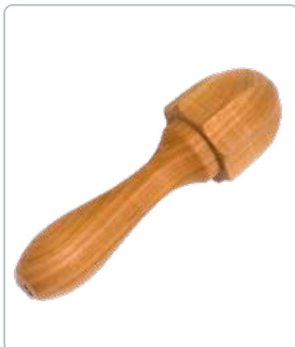
6846 CITRONPRESSER i kirsebærtræ Mål: 150 mm Funktionel og designet så man får fuld udnyttelse af citronsaften.