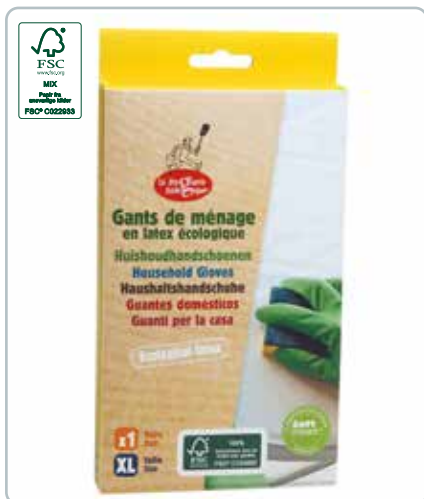
6725d LATEX HANDSKER str. XL FSC Gummiet er fra FSC certificerede plantager. Handskerne kan bruges til opvask, diverse husholdningsopgaver, havearbejde m.m.