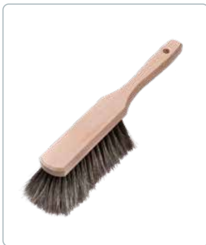
6860 HÅNDKOST med naturhår fra køer En lækker kost der ligger godt i hånden