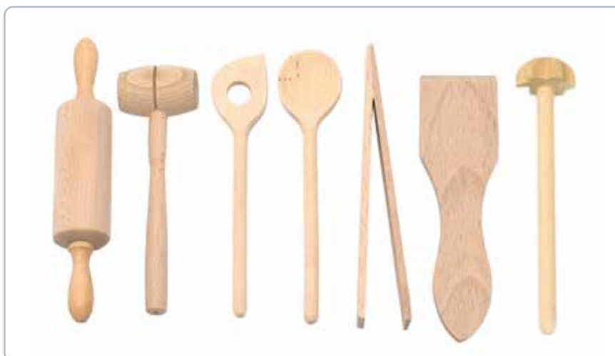
6890 BØRNEKØKKENSÆT i bøgtræ 7 dele Tag børnene med i køkkenet og skab en hyggelig fælles oplevelse.