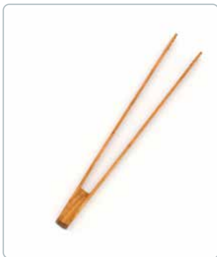
6824 MADTANG i kirsebærtræ Mål: 300 mm Let at håndtere og ligger godt i hånden.