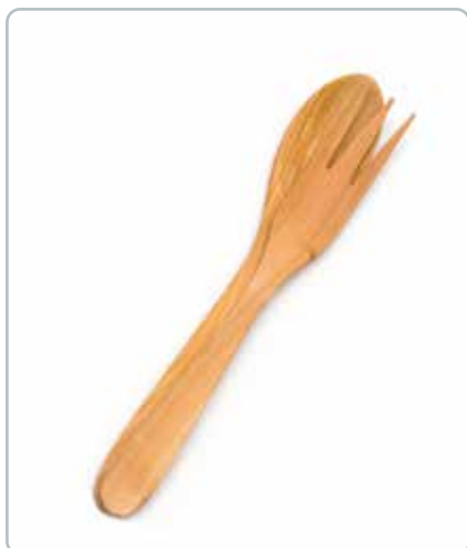
6847 SALATBESTIK i kirsebærtræ Mål: 300 mm Dekorativt bestik som ligger godt i hånden.