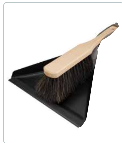
6861 KOST- OG FEJEBAKKESÆT Sættet består af en lækker kost i bøgetræ der ligger godt i hånden og en fejebakke af rustfrit stål.