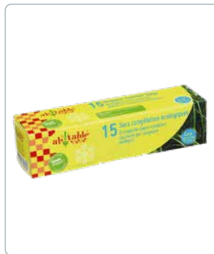
6737 FRYSEPOSER af bioplastik 15stk á 6L Miljøvenlige og lavet af biomasse. 100% genanvendelige og der følger lukkestrips med.