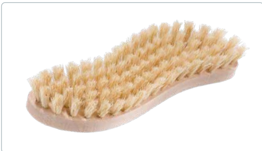
6854 RENGØRINGSBØRSTE af bøgetræ Mål: L210 x B70 x H40 mm Den kendetegnende S-form sørger for et godt greb, så man nemt kan skure bordet, skoene eller noget helt tredje. Fibrene på børsten af fra agave kaktussens bladribbe.