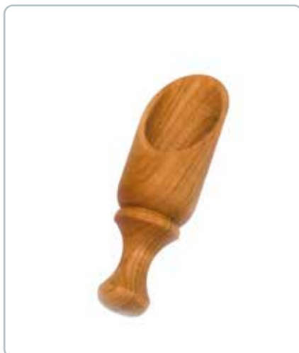
6844 SALT SKE stor i kirsebærtræ Mål: 90 mm Afrundede og bløde linjer som pynter i saltkaret, sukkerskålen m.m.