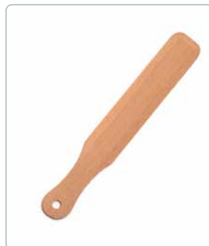
6981 CREPE VENDER i bøgetræ Mål: 300 mm Med de afrundede hjørner er den perfekt til hurtigt og nemt at vende pandekager.