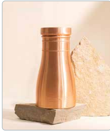
10075 LUXUS KOBBER KARAFEL MAT til vand Mål: 1000ml

Det er blevet anslået, at mindst 80% af alt kobber, der nogensinde er udvundet, stadig er i brug eller tilgængeligt til brug i dag, efter at være blevet genbrugt igen og igen. Kobbers evne til at blive genanvendt gentagne gange uden tab af ydeevne er en vigtig bæredygtig fordel.