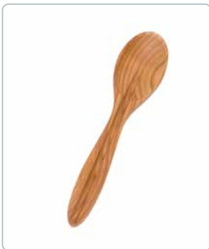
6832 SMAGE SKE i kirsebærtræ Mål: 190 mm Lang skaft med rille, som er god når man skal tilsmage saucer, gryderetter m.m.