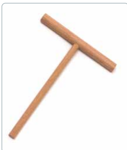
6983 CREPE DEJPIND i bøgetræ Mål: 210 x140 mm Gør det nemt at fordele dejen jævnt på panden.