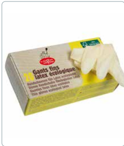
6726b LATEX HANDSKER tynde str. M FSC Bliv fri for tørre og beskidte hænder, og den plastikagtige lugt. Handskerne er puderfri. Du får et produkt som er bredt anvendeligt.